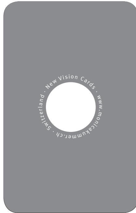
2. So meistere ich das.