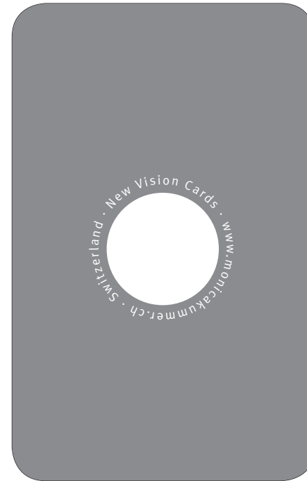
3. So meistere ich das nicht.